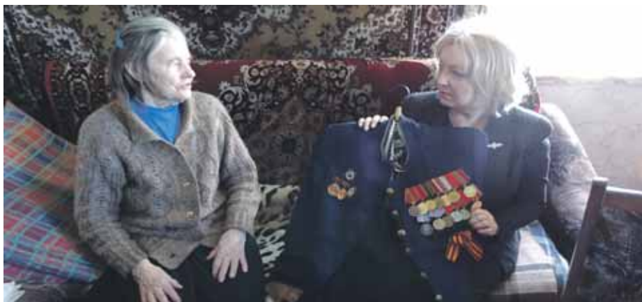
Право ветерана Великой Отечественной войны на обеспечение жильем помещением восстановлено. Для этого Уполномоченному потребовалось два года.