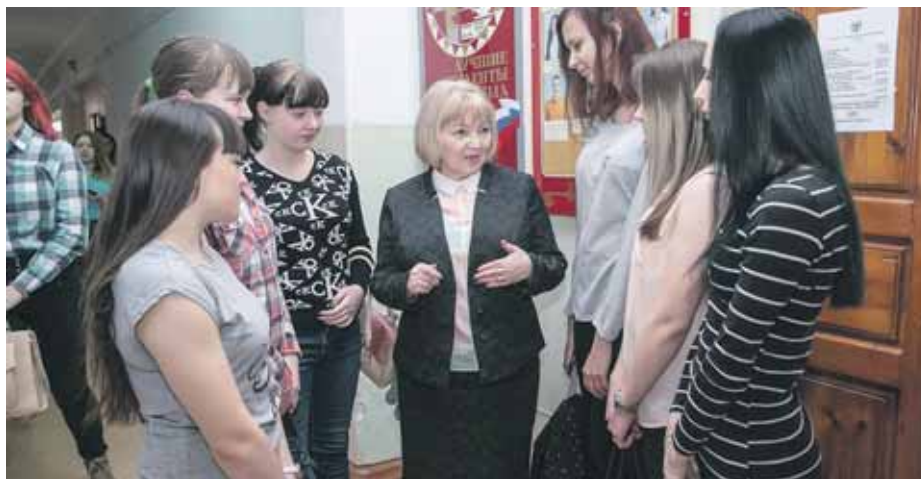
Беседа со студентами Новосибирского технологического колледжа питания (визит Уполномоченного был организован в рамках цикла встреч омбудсмена со студентами профессиональных образовательных учреждений, подведомственных министерству труда, занятости и трудовых ресурсов Новосибирской области).

— На то, что медицинские организации не соблюдают сроки проведения диагностических обследований или сроки ожидания медицинской помощи, на необоснованный отказ врачей выдать пациентам льготные рецепты. Весь прошлый год я несколько раз поднимала проблему оказания качественной медпомощи и лекарственного обеспечения больных диабетом и граждан с ВИЧ-инфекцией. Отмечу, что вопрос по перемещению Центра СПИД в другое помещение решён положительно. Также положительно решён вопрос с отдельным входом в здание для беременных женщин и детей. 10 лет у нас в области неуклонно растёт заболеваемость злокачественными новообразованиями. Уровень заболеваемости серьёзно превышает средний по стране. Уровень смертности от рака у нас также выше среднероссийского. И я не устаю повторять: у нас проблемы с онкологической службой, нам не хватает врачей-онкологов, у нас низкий уровень охвата населения профилактическими осмотрами. В феврале этого года я отправила обращение тогда ещё врио Губернатора Андрею Александровичу Травникову о необходимости строительства в Новосибирске современного онкологического диспансера. Он принял решение на этот год из областного бюджета выделить 58 миллионов рублей на разработку проектно-сметной документации на строительство област-