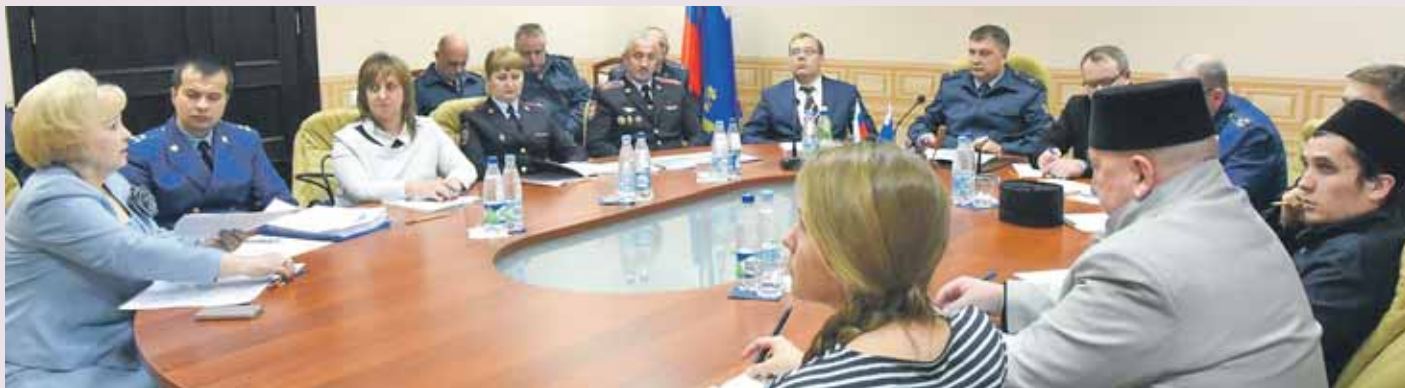
2 ноября 2017 года. Заседание круглого стола на тему «Исправление осуждённых и предупреждение ими новых преступлений» с участием представителей ГУ Минюста России по НСО, прокуратуры НСО и ГУФСИН России по НСО.

Прокуратура Новосибирской области и институт Уполномоченного по правам человека являются важными звеньями в отечественной системе обеспечения прав и законных интересов граждан.