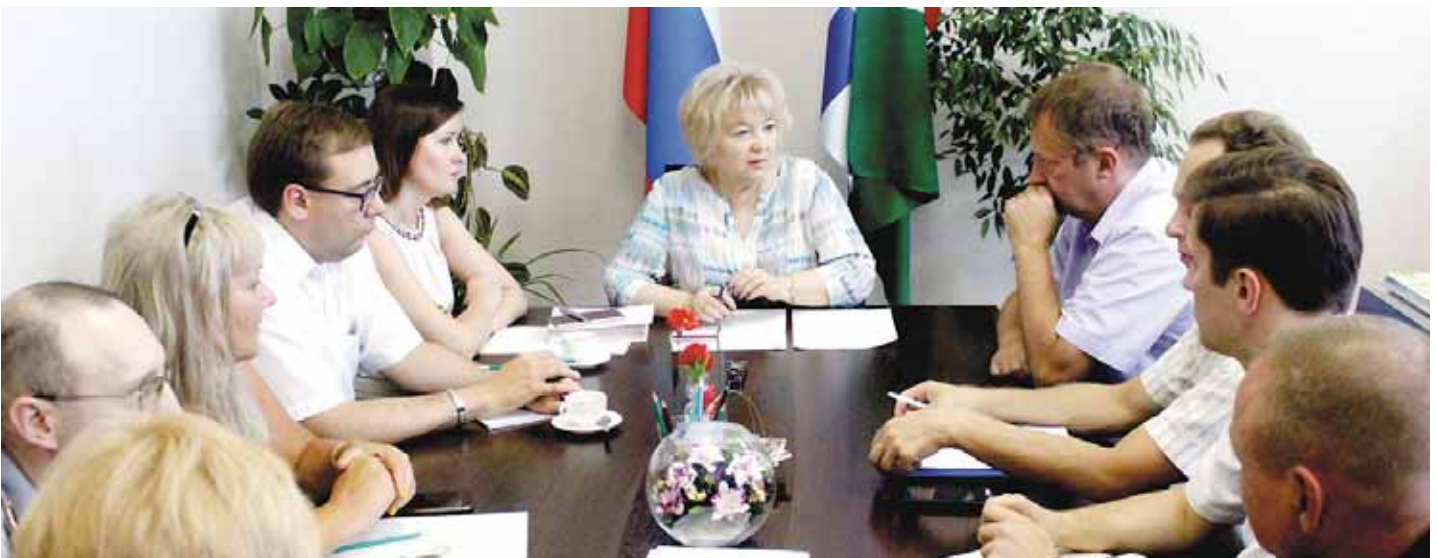
17 июля Уполномоченный провела заседание рабочей группы, сформированной по итогам Экспертного совета по вопросам защиты прав и свобод человека и гражданина.