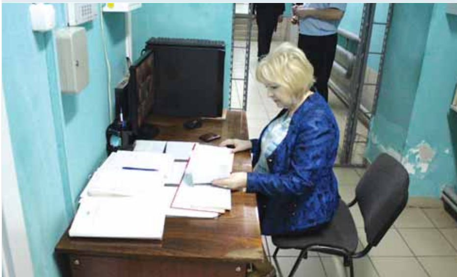
В изоляторе временного содержания в Чулыме.

16 человек. В изоляторе содержался один подозреваемый в совершении преступления, с которым Уполномоченный побеседовала. Гражданин пояснил, что находится в изоляторе первый день, жалоб на условия содержания и сотрудников он не имеет. В камерах имеется вентиляция, в изоляторе в целом проведён ремонт, однако на стенах отслоилась краска и штукатурка, образовался грибок. Уполномоченный также осмотрела прогулочный дворик, место для распределения пищи, аптечки для оказания первой помощи, журнал вызова скорой медицинской помощи.