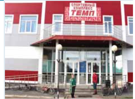
Спортивный комплекс в Венгерovo.

21 сентября омбудсмен посетила ГБПОУ НСО «Венгеровский центр профессионального обучения». Уполномоченный осмотрела помещения общежития (актовый зал, комнаты для мальчиков