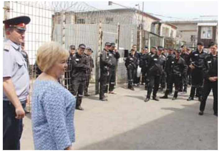
25 июня Уполномоченный выехала в ИК-3, где ознакомилась с условиями содержания осуждённых.