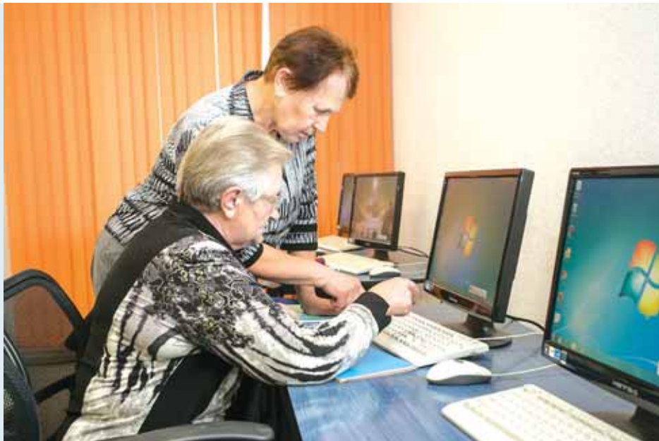
Современные пенсионеры — это люди с активной жизненной позицией, открытые к обучению.

Каждый октябрьский день 2018 года, кроме воскресений, в рамках поддержки социально-просветительского проекта «Правовой марафон для пенсионеров», инициированного Уполномоченным по правам человека в РФ Татьяной Москальковой, на территории города Новосибирска работали пункты оказания бесплатной юридической помощи гражданам старшего поколения.