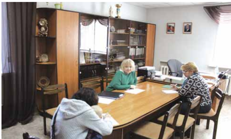
Личный приём граждан в Чанове.

Уполномоченная приняла четырёх жителей этого района. Трёх из них интересовали жилищные и трудовые вопросы.