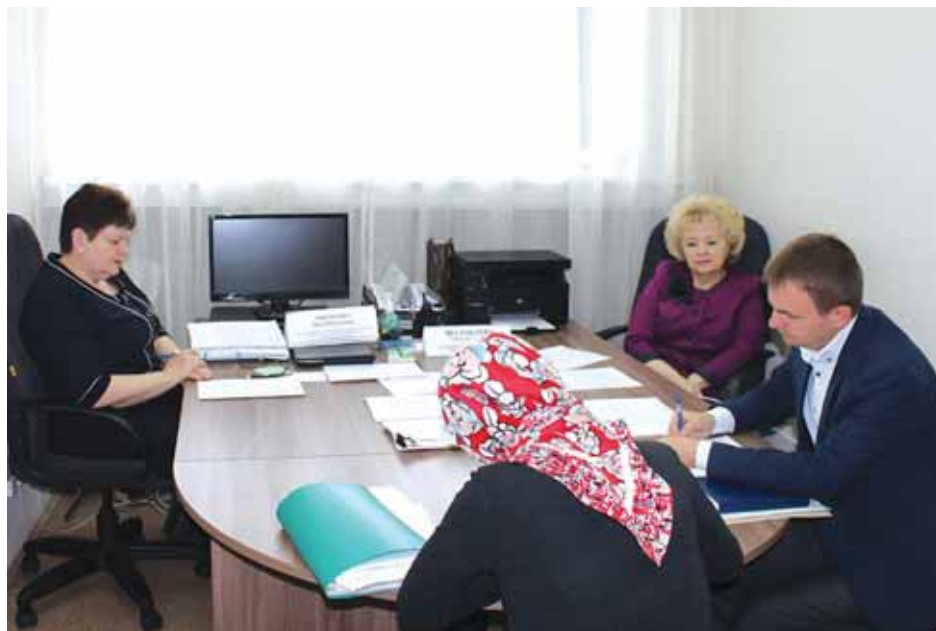
Совместный приём граждан Уполномоченного по правам человека в НСО и представителей отделения Пенсионного фонда по НСО.

Во время приёма поступали и жалобы. Так, граждане выражали несогласие с