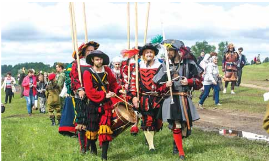
Более 500 реконструкторов участвовали в этом году в «Сибирском огне».

Экспозиции фестиваля позволили участникам и гостям не только посмотреть на реконструированные образцы одежды, предметы быта и снаряжения разных исторических эпох, но и примерить доспехи и оружие, попробовать свои силы в древних ремёслах и народных забавах. Кроме того, зрителям предоставили возможность станцевать исторические танцы начала XIX века и спеть песни на фронтовом привале 1943 года. Для детей и подростков работали интерактивные площадки.