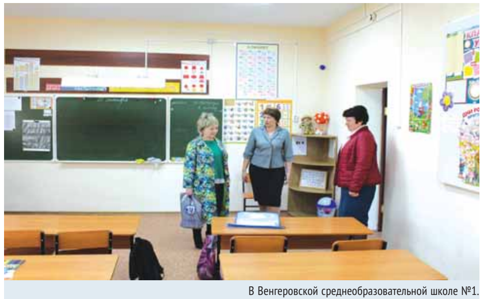
В Венгеровской среднеобразовательной школе №1.

Нина Шалабаева посетила социально-реабилитационное отделение для несовершеннолетних, в котором по различным причинам проживают дети. Уполномоченный отметила, что это учреждение помогает детям из различных проблемных семей не терять точки соприкосновения с родными и близкими.