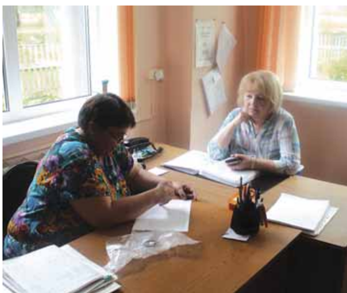
13 июня состоялась рабочая поездка в Чулымский район.