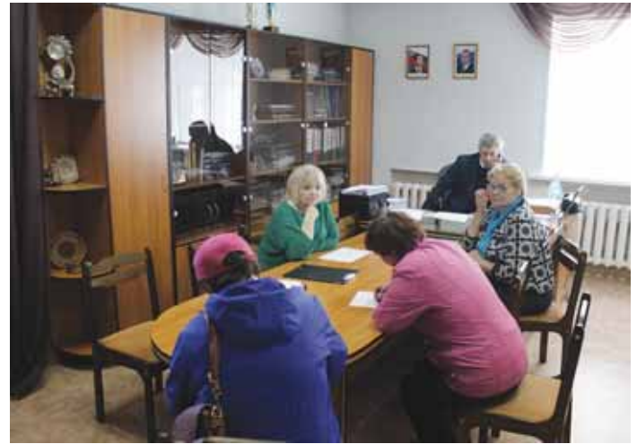
19 сентября Уполномоченный провела приём граждан в Чановском районе.