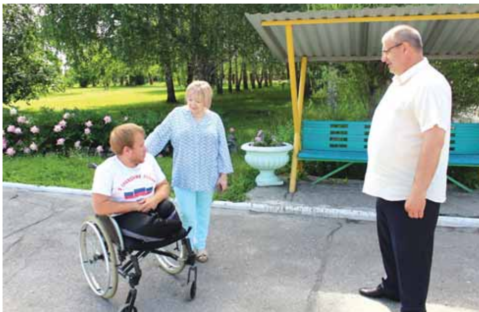
В Обском психоневрологическом интернате проживают 160 человек.

Уполномоченный осмотрела блоки для проживания детей, столовую, медицинский блок. Жилые блоки и столовая были отремонтированы в соответствии с требованиями санитарно-эпидемиологических норм и правил. В помещениях имеется пожарная сигнализация, указатели, в том числе световые, огнетушители, оборудованы эвакуаци-