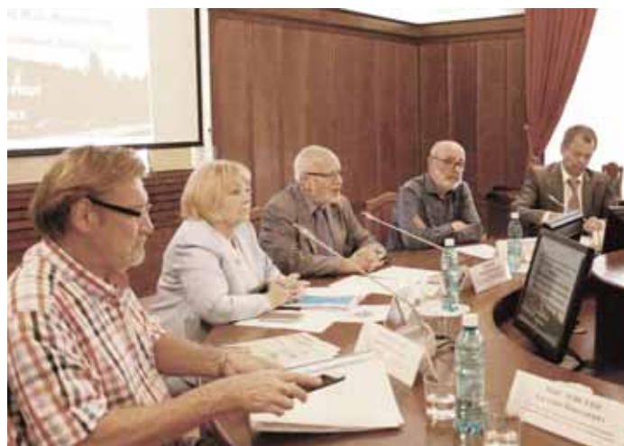
15 августа прошла встреча с правозащитниками в рамках визита в Новосибирск председателя Совета при Президенте РФ по развитию гражданского общества и правам человека Михаила Федотова.