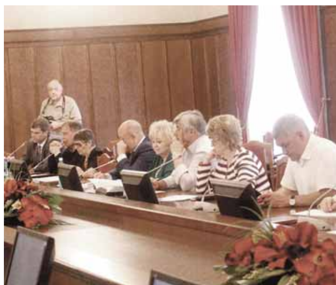
15 июня Уполномоченный приняла участие в заседании комитета Заксобрания НСО по социальной политике, здравоохранению, охране труда и занятости населения.