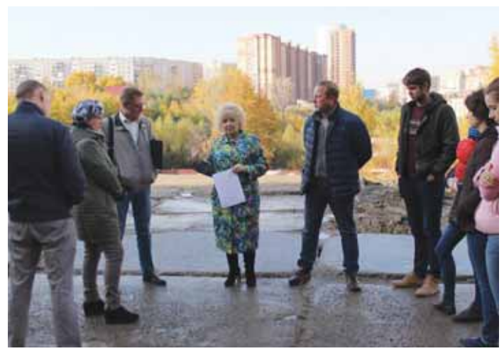
26 сентября Уполномоченный встретилась с жильцами дома №17 по ул. Танковой в Новосибирске, заявлявших о нарушении требований к строительству многоэтажных жилых домов, организации работ на строительной площадке.