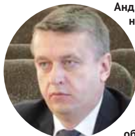
Андрей МИХАЙЛОВ, начальник управления жилищной политики и развития ЖКХ министерства ЖКХ и энергетики Новосибирской области:

мированию ЖКХ с 1 января 2019 года – это повлечёт значительное сокращение субсидий на расселение аварийного жилого фонда.