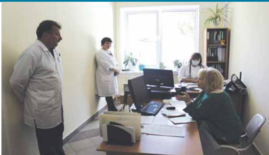
В Кыштовской центральной районной больнице.

Побывала Уполномоченная и в детском саду «Солнышко», где осмотрела музыкальные классы, спортзал, детские площадки, пищеблок, игровые комнаты,