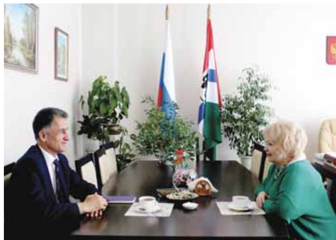
24 июля состоялась рабочая встреча Уполномоченного с консулом Республики Таджикистан.