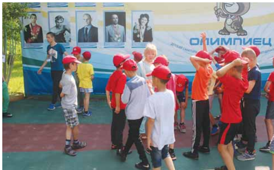
Ребята, отдыхающие в лагере «Олимпиец», рассказали омбудсмену, что хотят вернуться сюда и в будущем году.

Уполномоченный обратила внимание на то, какие меры пожарной безопасности принимаются руководством учреждения. Выяснилось, что помещения Обского психоневрологического интерната оборудованы системой оповещения о пожаре, имеются огнетушители, на каждом этаже есть планы эвакуации и уголки противопожарной безопасности с иллюстрациями, выполненными воспитанниками интерната. Эвакуационные выходы из здания имеют указатели, в том числе световые, выходы имеют свободный доступ, двери открываются без каких-либо ограничений.