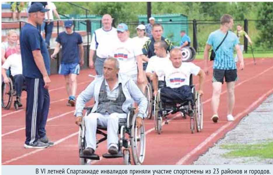
В VI летней Спартакиаде инвалидов приняли участие спортсмены из 23 районов и городов.

Что же касается нынешней Спартакиады, то основная борьба развернулась между черепановцами, болотнинцами и представителями города Искитима. В итоге сильнее всех оказались хозяева Спартакиады. А болотнинцы в борьбе за второе место всего два бала уступили представителям Искитима и замкнули тройку призёров.