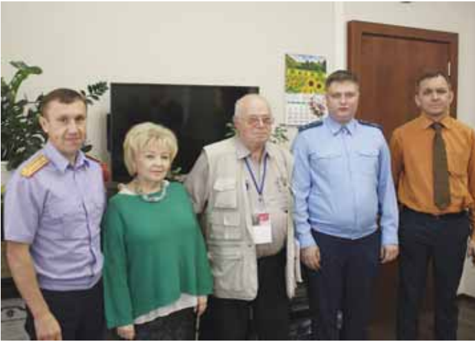
15 августа состоялся совместный приём граждан Уполномоченного и членов Совета при Президенте РФ по развитию гражданского общества и правам человека.