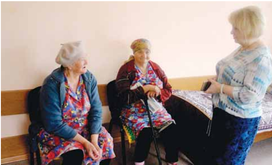
Одиноким пожилым людям особенно важно общение.