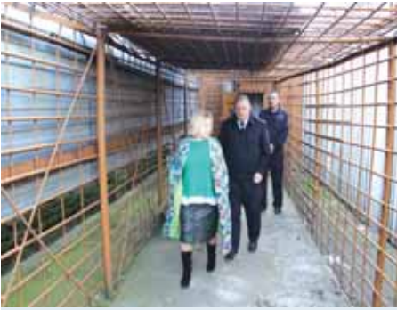
В изоляторе временного содержания Чановского района.

что в учреждении имеется своё небольшое подсобное хозяйство, пекарня, баня. Уполномоченный осмотрела все помещения учреждения и поблагодарила руководство и обслуживающий персонал за оказываемую помощь пожилым людям.