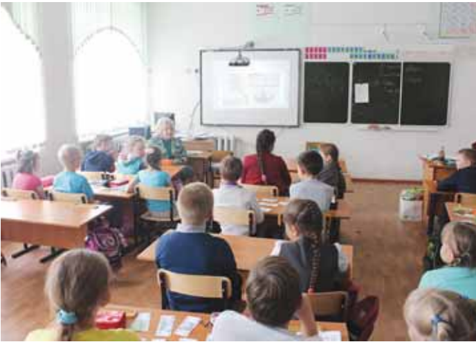
18 сентября омбудсмен посетила Кыштовскую среднеобразовательную школу №1.