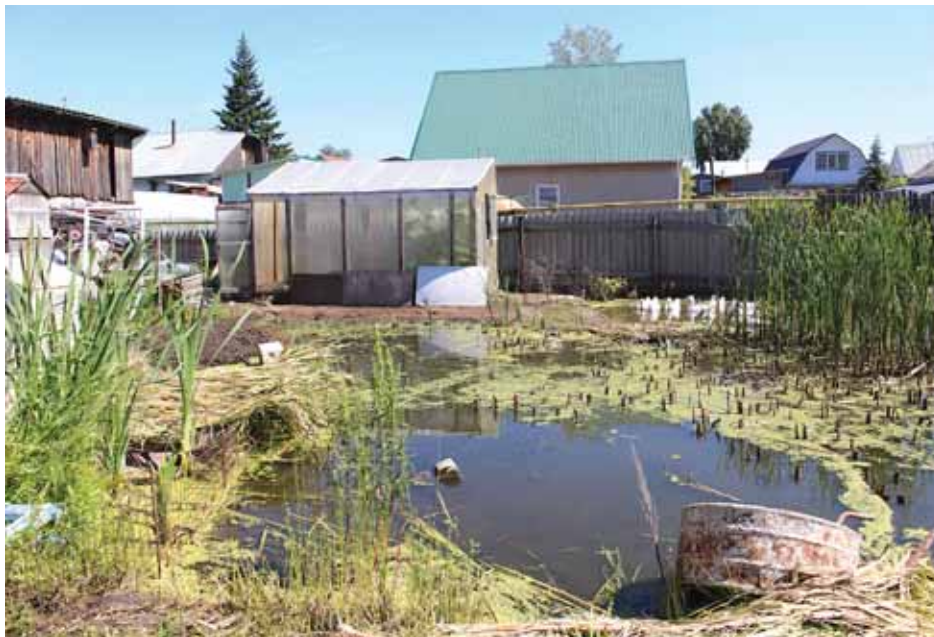
Частные дома на ул. Октябрьской в Бердске разрушаются из-за подтоплений.