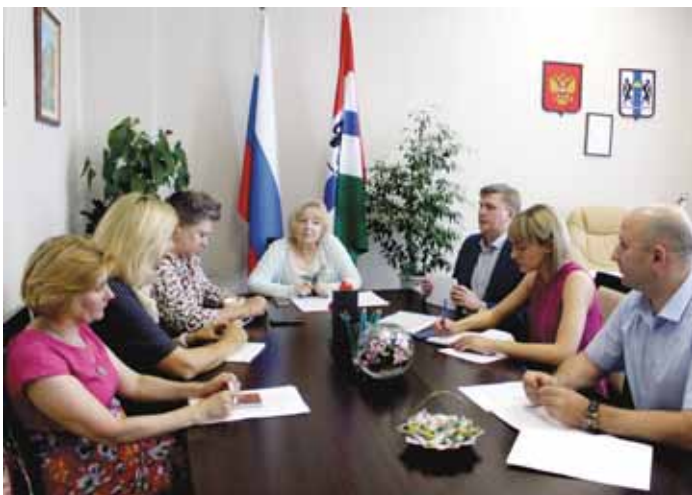
20 июля состоялось заседание рабочей группы по вопросам оказания бесплатной юридической помощи.