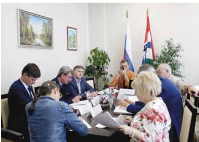
14 августа в приёмной Уполномоченного прошёл приём граждан совместно с представителями Совета при Президенте РФ по развитию гражданского общества и правам человека.