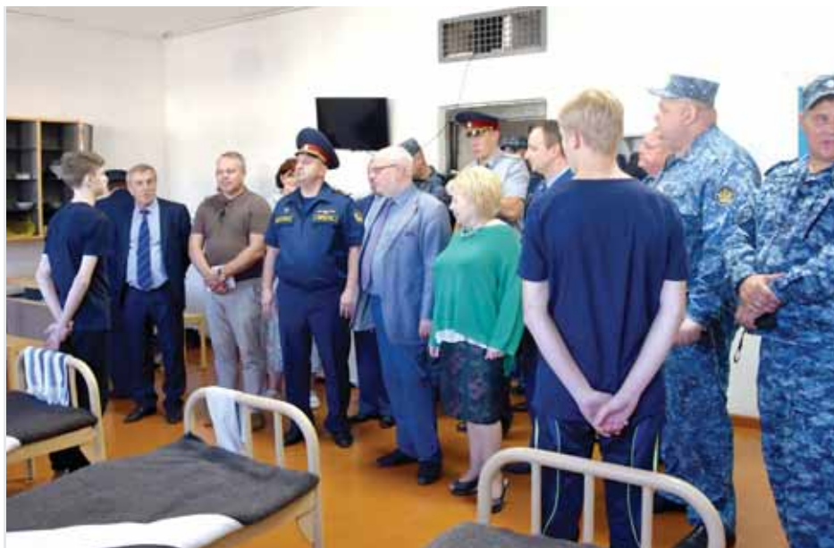
Визит в воспитательную колонию.

— И в женской ИК-9, и в мужской ИК-8 строгого режима я встретила с редкой отзывчивостью руководителей на все пожелания. Вопросы о применении силы и пытках вызывают у заключённых недоумение — и это контраст с Омской областью, где издевательства над заключёнными входят чуть ли не в ежедневный обиход. Но по территории женской колонии невозможно ходить — там отсутствует асфальт, вместо него непонятные куски панелей. А в ЕПКТ — едином помещении камерного типа в мужской колонии — практически нет никаких условий для элементарного удоб-