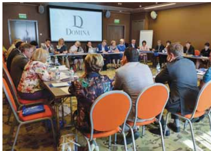
27 июля состоялся круглый стол, на котором обсуждались вопросы защиты профессиональных прав адвокатов.