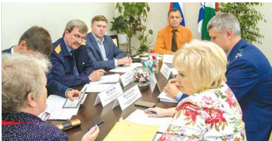
Приём граждан вместе с представителями Совета при Президенте РФ по развитию гражданского общества и правам человека

— Сегодня несовершеннолетних правонарушителей отправляют в СИЗО, и я считаю, что это неверно. На базе воспитательных колоний надо создавать помещения, функционирующие в режиме СИЗО, а также участок общего режима для перевода туда тех воспитанников колонии, которым исполняется 18 лет. Это нужно для того, чтобы они не соприкасались со взрослым криминальным миром, так как наша задача — возвращать молодёжь в нормальный мир. И это будет своего рода комплекс для несовершеннолет-