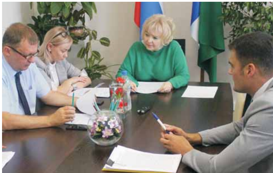
Заседание рабочей группы.

Она подчеркнула: работа Уполномоченного предполагает не только выявление проблем в соблюдении прав человека, но и анализ причин и условий, создающих предпосылки для нарушения прав жителей области. Основные группы проблем выделяются исходя из обращений граждан и фактов, выявляемых в результате выездных проверок, мероприятий, рабочих встреч. Пять таких вопросов были вынесены на заседание Экспертного совета, рассказала она. Это сложившаяся в области ситуация с онкологической заболеваемостью и проблемы оказания паллиативной медицинской помощи; переселение из аварийного жилья; обеспечение жильём детей-сирот, детей, оставшихся без попечения родителей, лиц из числа детей-сирот и детей, оставшихся без попечения родителей; бесплатная юридическая помощь людям в трудной жизненной ситуации и проблемы в её оказании; медицинское освидетельствование осуждённых, представляемых к освобождению в связи с болезнью, и дальнейшая помощь тем, кто освобождён из мест лишения свободы по этой причине.