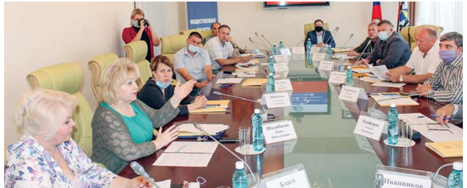
31 августа омбудсмен выступила на круглом столе «Роль институтов гражданского общества в обеспечении чистоты и прозрачности выборов».