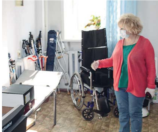
22 сентября омбудсмен осмотрела помещения Новосибирского областного геронтологического центра в ходе выездной проверки по коллективному обращению сотрудников центра.