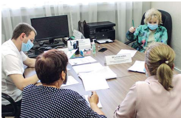
5 мая Уполномоченный провела очередной приём граждан.