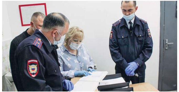
11 сентября омбудсмен посетила спецприёмник для содержания лиц, арестованных в административном порядке, где ознакомилась с журналом вызовов скорой помощи.