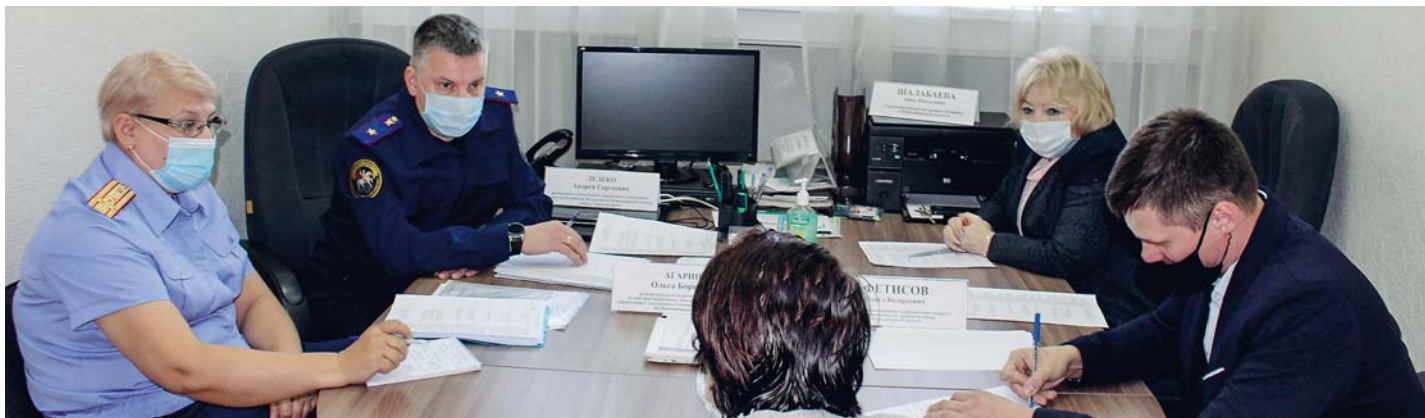
Совместный приём с руководителем Следственного управления Следственного комитета РФ по НСО Андреем Лелеко 30 сентября.

Эффективно зарекомендовала себя практика совместных приёмов омбудсмана и представителей различных ведомств. Безусловно, такая практика будет продолжена.