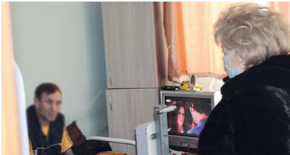
Выездная проверка в Дом милосердия.

В ходе выезда Уполномоченный осмотрела помещения Дома милосердия, отметила стойкий неприятный запах на втором этаже, отсутствие возможности для тех, кто живёт на этом этаже, выйти на улицу, несоблюдение санитарно-гигиенических требований.