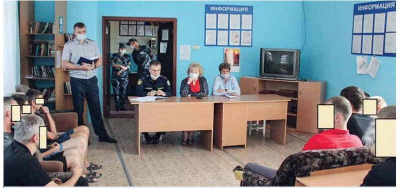
24 августа Уполномоченный встретила и ответила на вопросы граждан, отбывающих наказание в УФИЦ ФКУ ИК-3 ГУФСИН России по НСО.