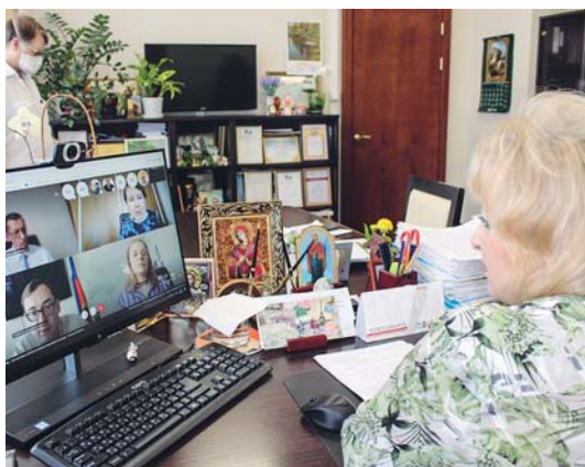
13 мая омбудсмен приняла участие в онлайн-конференции «Реализуемые меры по поддержке граждан и организаций в связи с распространением новой коронавирусной инфекции», организованной ГУ Минюста России по НСО.