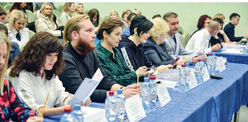
9 октября Уполномоченный по правам человека в качестве члена жюри приняла участие в подведении итогов первого этапа конкурса «Мисс УИС».