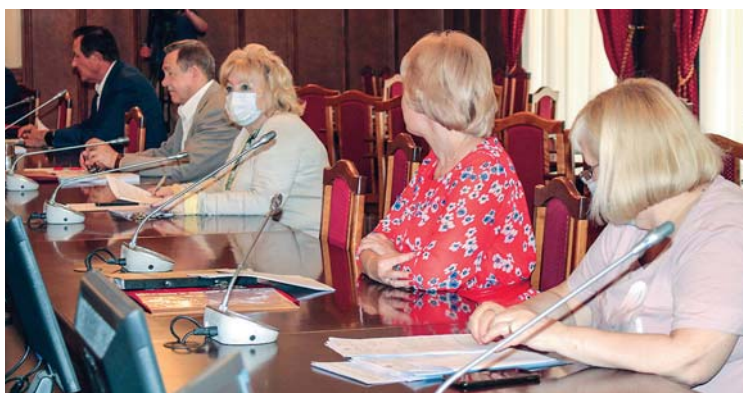
26 мая омбудсмен приняла участие в заседании комитета Законодательного Собрания Новосибирской области по госполитике, законодательству и местному самоуправлению.