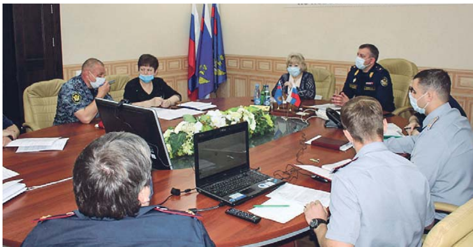
Приём граждан Уполномоченным совместно с ГУФСИН России по НСО.