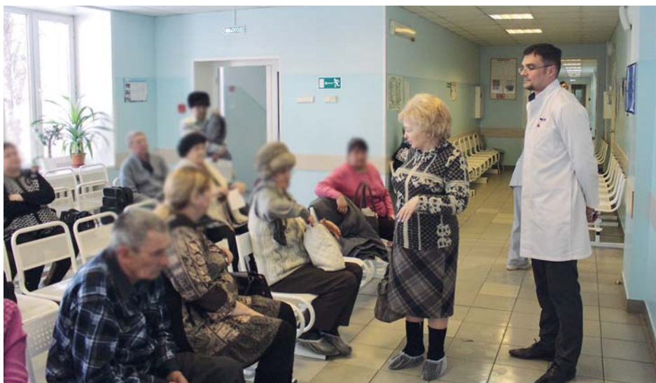
В Новосибирском областном онкологическом диспансере.

Только 7 центральных районных больниц укомплектованы участковыми терапевтами на 100%. В остальных ЦРБ эта цифра составляет от 32% до 87%. Самое тяжёлое положение – в Кыштовской, Доволенской и Северной ЦРБ.