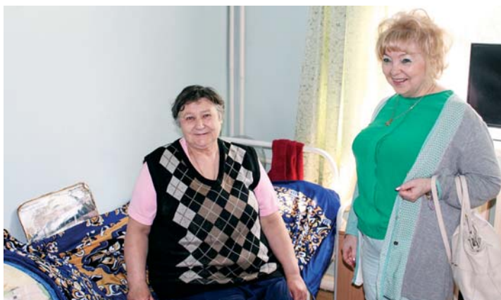
11 июля Уполномоченный посетила Новосибирский дом ветеранов, где пообщалась с его постояльцами.