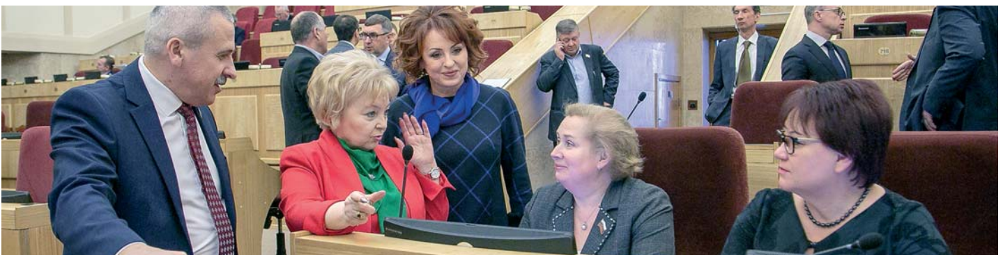
21 ноября омбудсмен по традиции приняла участие в сессии Законодательного Собрания Новосибирской области.