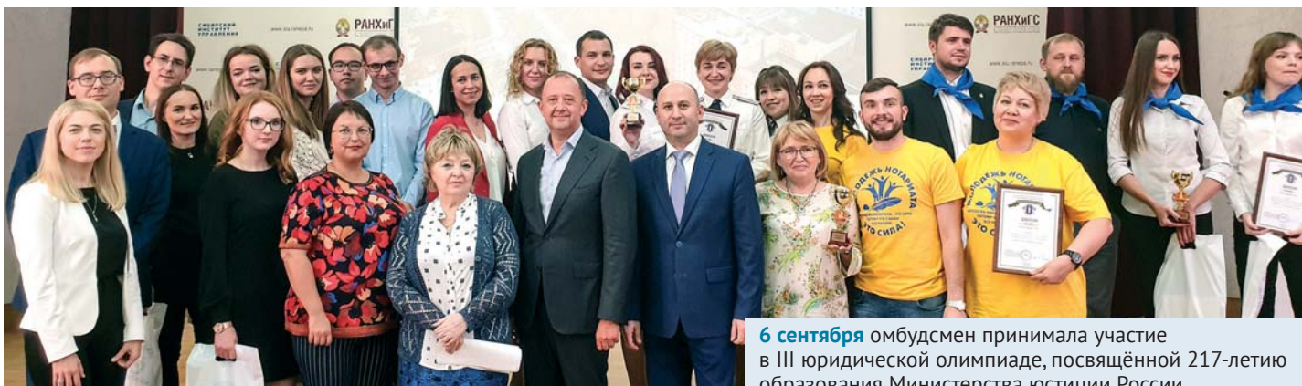
6 сентября омбудсмен принимала участие в III юридической олимпиаде, посвящённой 217-летию образования Министерства юстиции России.