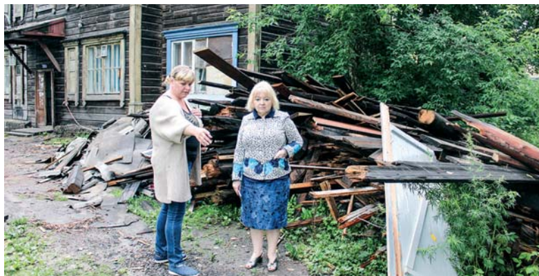
19 июля омбудсмен выезжала в Первомайский район, чтобы на месте разобраться в ситуации, описанной в коллективном обращении жителей многоквартирного дома №22 по улице Красный факел.