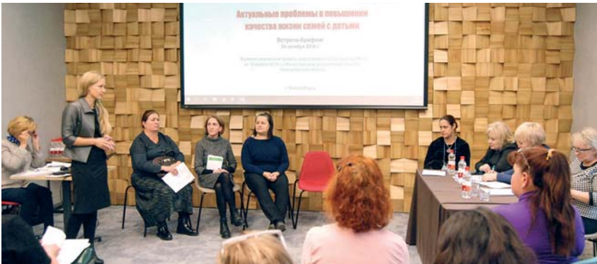
24 октября Уполномоченный участвовала во встрече-брифинге «Актуальные проблемы в повышении качества жизни семей с детьми», организованной Благотворительным фондом «Дети России – Будущее Мира». Среди участников – представители многодетных и неполных семей, а также семей мигрантов.