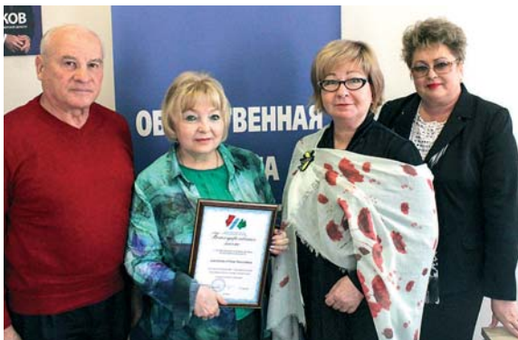
3 сентября в Общественной палате Новосибирской области прошло онлайн-совещание по вопросам, связанным с процедурой выдвижения кандидатур в составы ОНК субъектов РФ.