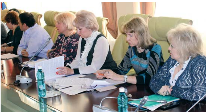
6 ноября Уполномоченный отстаивала права многодетных семей на рабочей группе комитета по социальной политике и здравоохранению Законодательного Собрания.