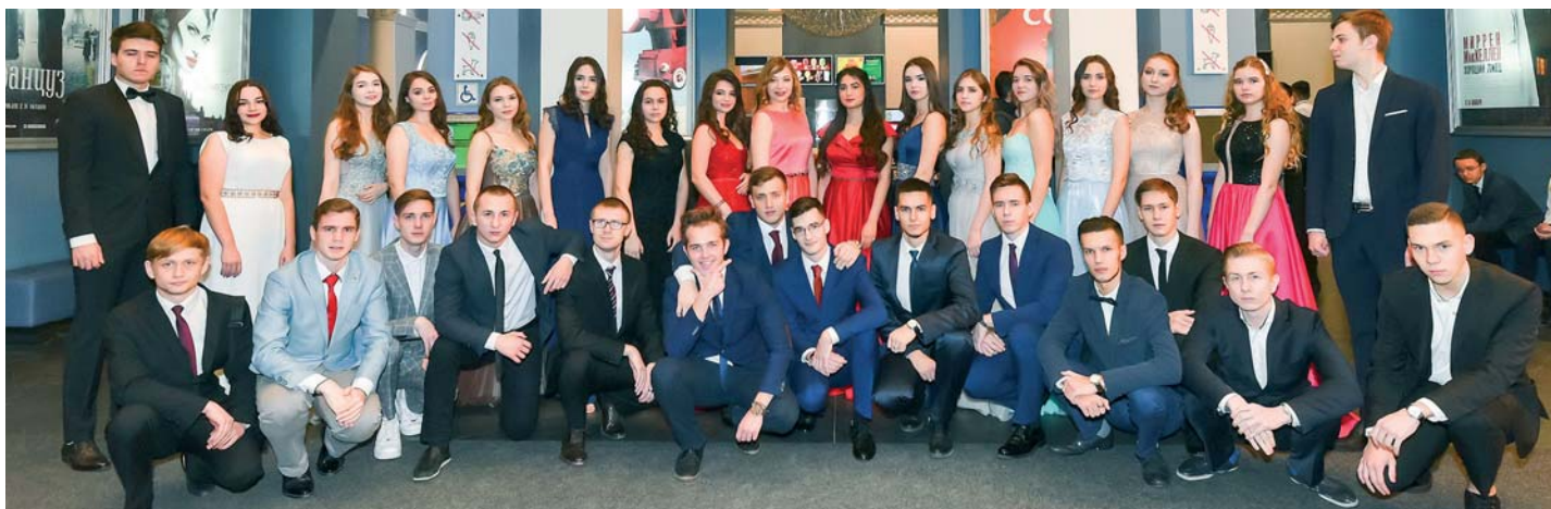
Международный кинофестиваль «Золотой след-2019».

здорового образа жизни. Здесь уделяется большое внимание спортивной и культурно-массовой работе, реализуются программы по морально-этическому и патриотическому воспитанию. Но главное – это практическое применение получаемых знаний с самого начала обучения. Вуз связан договорными отношениями с более чем сорока учреждениями и организациями. В большинстве из них студенты имеют право проходить все виды практик. Многие из практикантов занимаются в кадровый резерв. К последнему курсу студенты вуза, как правило, уже определяются с постоянным местом работы.