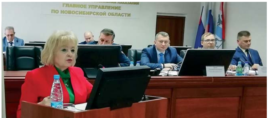
8 октября Уполномоченный выступила с докладом на заседании Координационного совета при Главном управлении Министерства юстиции России по НСО.