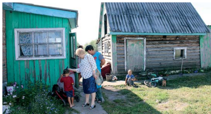
7 августа Уполномоченный побывала в Колыванском районе, где работала с обращением многодетной матери.