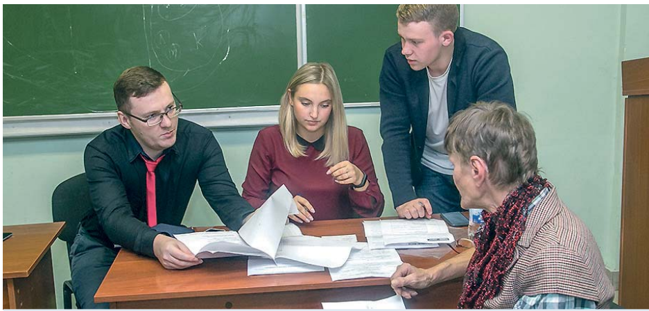
Студенты НЮИ(ф) ТГУ ведут бесплатный приём граждан.

клиентам клиники, сами получают бесценный опыт, который в дальнейшем обязательно будет им полезен.