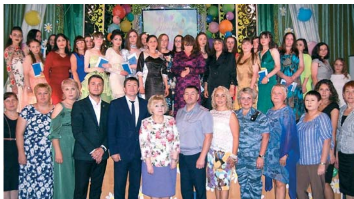
27 июня омбудсмен приехала на выпускной вечер в женскую исправительную колонию №9, чтобы поздравить выпускниц с получением аттестатов о среднем образовании.