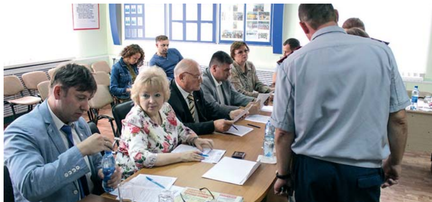
В тот же день, 28 августа , омбудсмен принимала участие в работе комиссии по вопросам помилования на территории НСО.