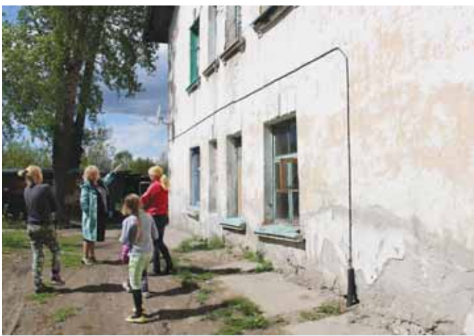
22 мая омбудсмен выезжала на место по обращениям жительниц Калининского района Новосибирска о нарушении их жилищных прав. Цель поездки – проверка доводов заявителей.