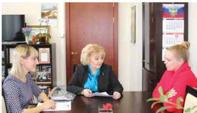
На встрече со студенткой, завершившей практику в аппарате Уполномоченного по правам человека, 1 февраля .