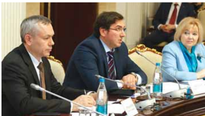
30 января Уполномоченный по правам человека приняла участие в расширенной коллегии министерства региональной политики Новосибирской области.