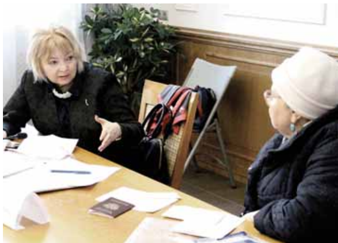
22 марта омбудсмен приняла участие в приёме граждан, организованном региональным отделением Ассоциации юристов России в Общественной приёмной мэрии города Новосибирска.