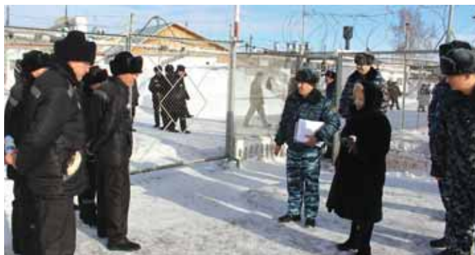
Визит омбудсмена в мужскую колонию строгого режима в п. Горный Тугучинского района 19 февраля .