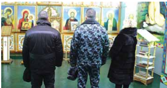
В Храме на территории ФКУ ИК-21 ГУФСИН России по Новосибирской области 19 февраля .