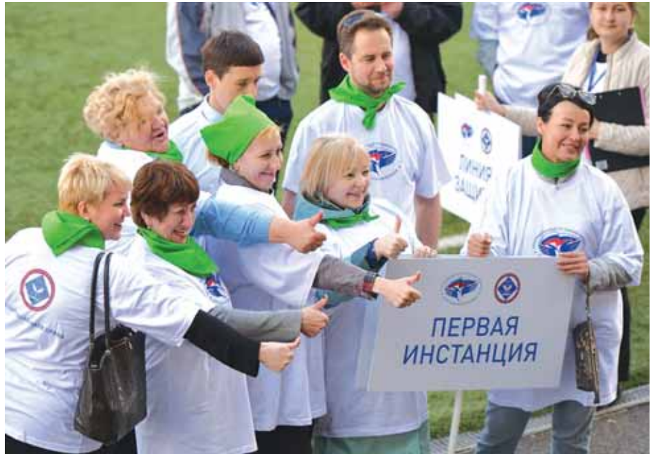
Обучающий тренинг для региональных омбудсменов: интересно и полезно.

В прошлом году прокурорами России было выявлено 630 тысяч нарушений трудового законодательства, рассказала