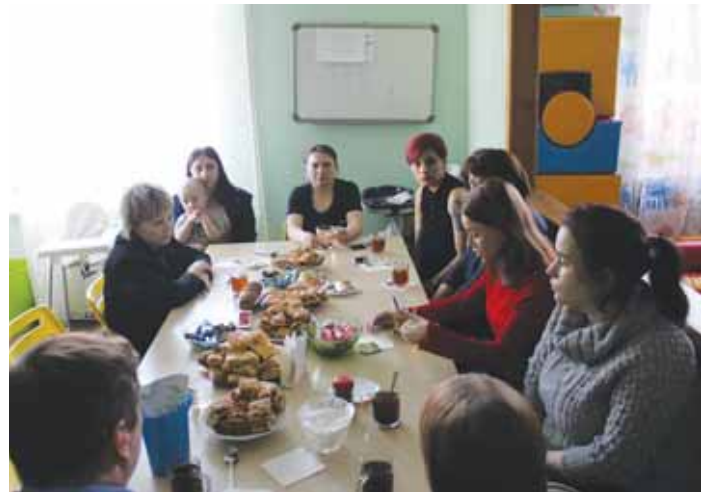
Беседа с женщинами материнской обители «Голубка» 15 марта .