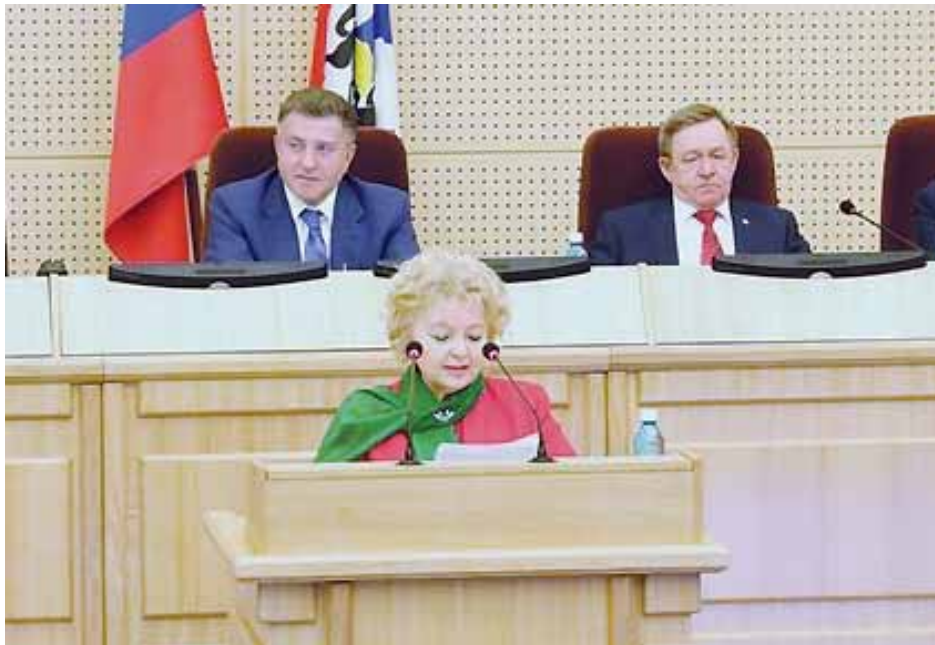
Выступление с ежегодным докладом на сессии Законодательного Собрания 30 мая 2019 года.

Совместные приёмы Уполномоченный проводит не только с Пенсионным