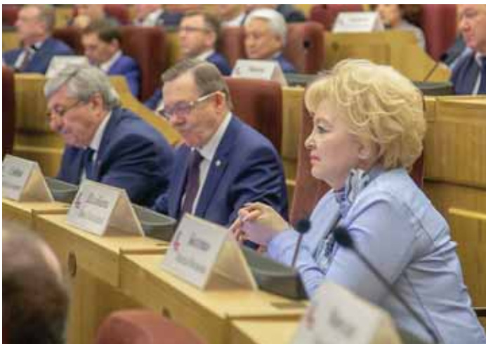
26 апреля в Законодательном Собрании области прошло торжественное заседание, посвящённое 25-летию законотворческой деятельности.