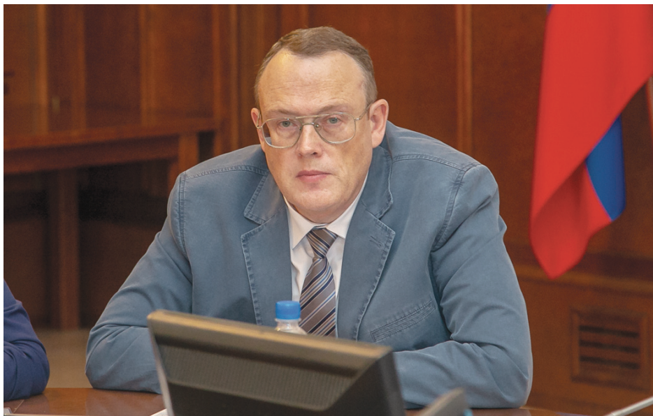
Омбудсмен Марк Денисов убеждён: «Для людей, освободившихся из мест лишения свободы, самое страшное — пренебрежительное отношение окружающих».

— Все мытарства бывших осуждённых начинаются именно после их освобождения, — поддерживает коллегу Уполномоченный по правам человека в Красноярском крае Марк Денисов . — Самое