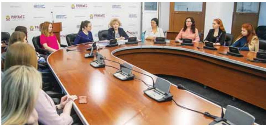
Встречи со студентами Сибирского института управления РАНХиГС.

— Тем студентам, которые приходят ко мне, я всегда говорю: «Посмотрите, на что жалуются граждане». Они жалуются