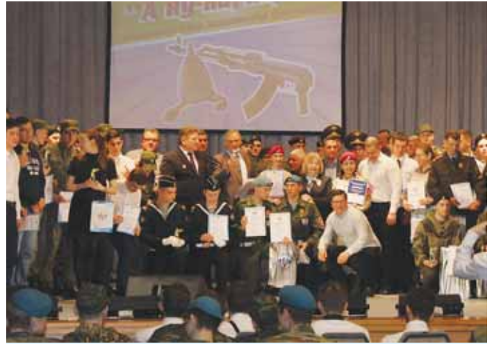
Фотографирование на память после награждения победителей областного военно-спортивного конкурса «А ну-ка, парни!», который прошёл в ДК Октябрьской революции 21 февраля .