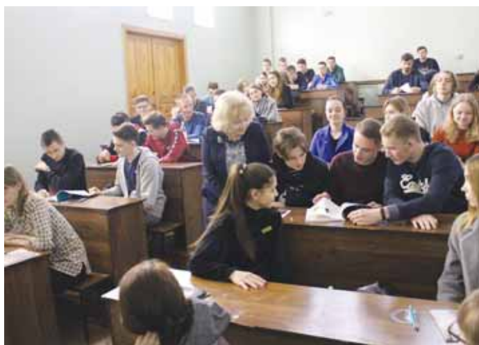
5 апреля на встрече со студентами Сибирского государственного университета водного транспорта.