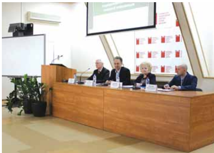
24 апреля Уполномоченный выступила в режиме видеоконференцсвязи перед специалистами публичных центров правовой информации, созданных на базе библиотек.