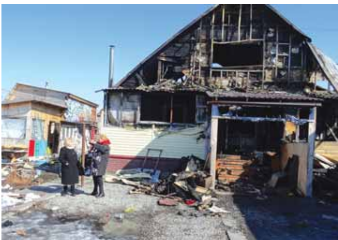
У дома погорельцев в селе Новолуговое Новосибирского района 26 марта.