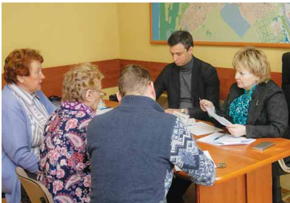
На личный приём в Бердске к Уполномоченному пришли 29 человек.

Ещё одна проблема, на которую обратила внимание гражданка П., — грунто-