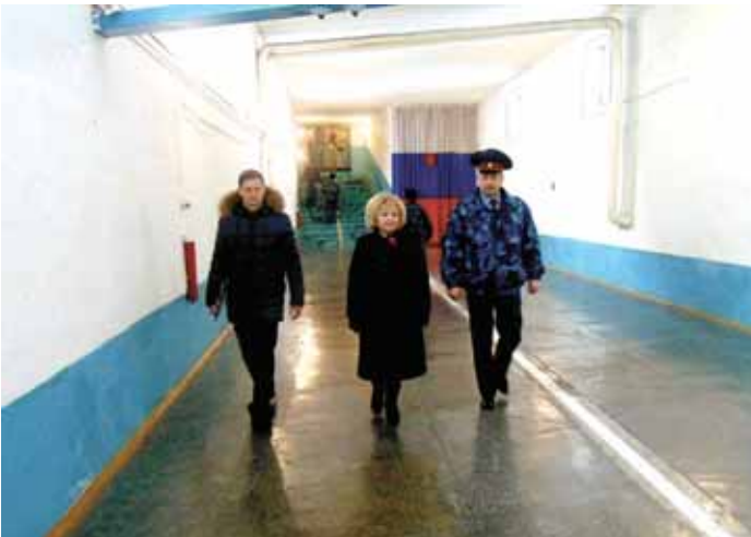
11 марта омбудсмен проверила условия содержания граждан в СИЗО-1.