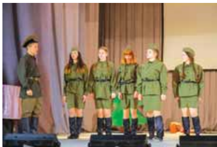
Постановка «А зори здесь тихие»

Участниками конкурса стали детские творческие коллективы из пяти социаль-