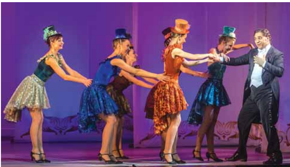
Юбилейное торжество в Музыкальном театре. Февраль 2019 г.

Но нет пророка в своём Отечестве! Мы видим, что строятся новые спортивные арены и всё внимание отдано соревнованиям и развитию спорта. Хочется, чтобы представители власти, от которых зависит финансирование театров, относились к ним с большим вниманием и заботой, чтобы общество оценило труд людей, добросовестно работающих в театрах, создающих культурное богатство региона и страны.