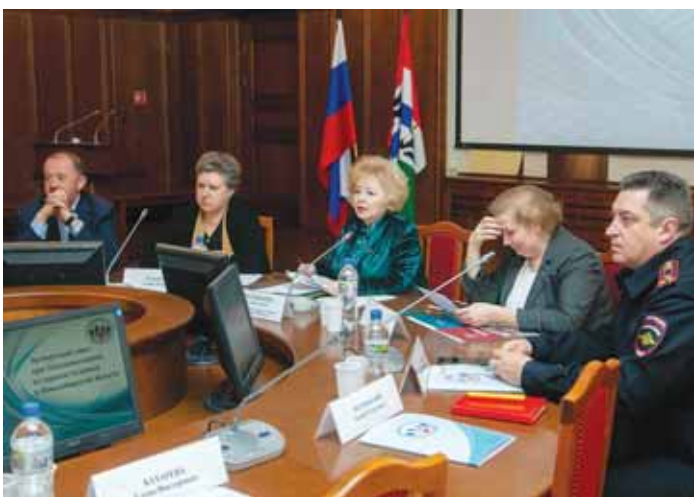
3 апреля омбудсмен провела очередное заседание Экспертного совета при Уполномоченном по правам человека.