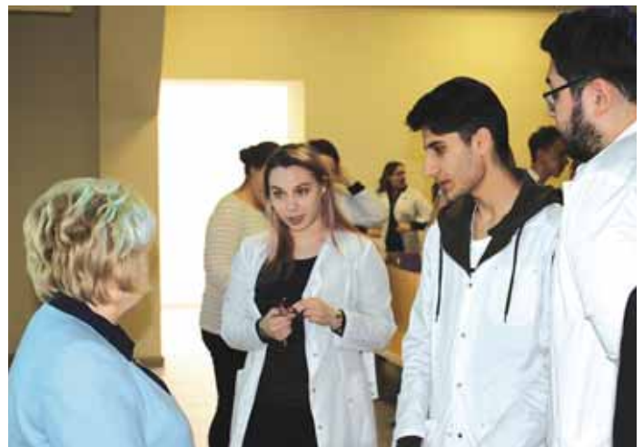
18 марта Уполномоченный по правам человека прочитала лекцию студентам Новосибирского государственного медицинского университета в рамках Всероссийского единого урока «Права человека».